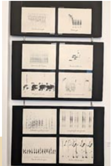
Sonagrammes reproduisant le chant de différentes espèces d'oiseaux.