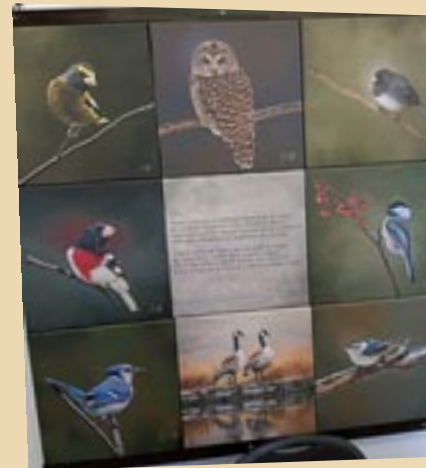
Quelques espèces d'ici (huit oiseaux présentés avec un texte explicatif).