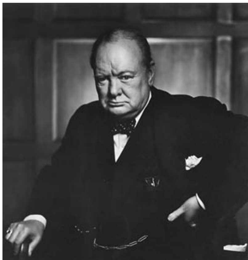
20 e siècle : Winston Churchill, 30 décembre 1941, Musée des beaux-arts du Canada, Ottawa.

les premières prises de vues sous-marines et l'utilisation de la radiographie, en 1895, prend le terme d'« imagerie » en sciences médicales. Les portraitistes immortalisent monarques, savants et artistes, tandis que la faune et la flore deviennent la cible des photographes animaliers. Les clichés de famille que l'on consigne dans un album deviennent accessibles et populaires.