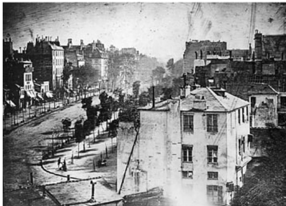
19 e siècle : Louis-Jacques-Mandé Daguerre, Boulevard du Temple, Paris, v.1838, daguerrotype.

Avant la photographie, c'est la peinture qui avait pour rôle la représentation de la réalité. Dès son invention, l'usage de la photographie