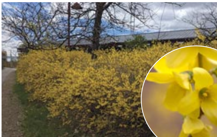
Quatre pétales jaunes soudés ensemble

Certaines années, le printemps est tardif, comme cette année. En même temps, beaucoup d'espèces vivantes règlent leurs activités et leur croissance en fonction de la durée du jour, ce que nous appelons la photopériode. C'est pourquoi, à peu près au même moment tous les ans, les arbres fleurissent, certains mammifères sortent de leur torpeur hivernale et les oiseaux reviennent au pays.