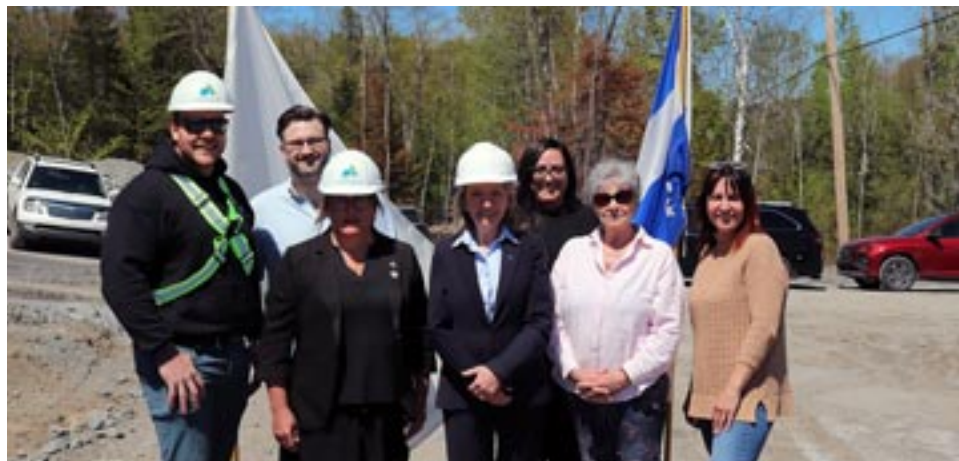
Personnalités présentes lors de la conférence de presse annonçant la nouvelle construction d'un garage municipal.

« Notre gouvernement est fier d'investir dans les infrastructures municipales partout au Québec. Un garage qui répond aux besoins de la population, c'est essentiel pour le dynamisme d'une Municipalité et la qualité de vie des citoyens et citoyennes. C'est d'ailleurs la communauté qui est la véritable bénéficiaire des services qui y sont offerts. Merci à Saint-