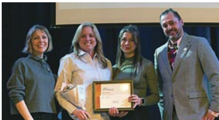
Photo prise lors de PANORAMA / Défi OSEntreprendre local.

Maison Hérisson 8 rue Simard à Saint-Hippolyte Site Internet : maisonherisson.ca Page Facebook