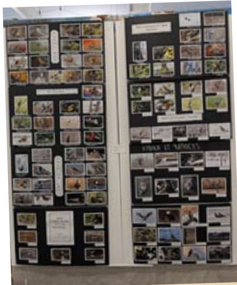
Murale qui contient plusieurs photos d'oiseaux.