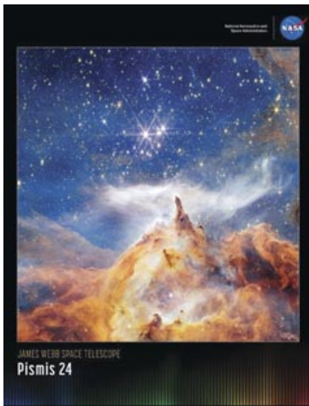
21 e siècle : Pismis 24 est un brillant amas d'étoiles situé au cœur de la nébuleuse du Homard dans la constellation du Scorpion.

PHOTO YOUSUF KARSH, PORTRAITISTE CANADIEN D'ORIGINE ARMÉNIENNE (1908-2002) CONSIDÉRÉ COMME L'UN DES MAÎTRES DU GENRE.