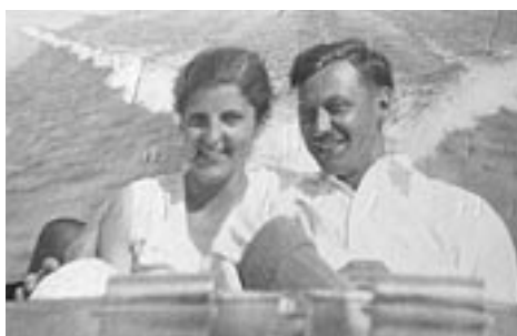
1932 : voyage de noces au lac Memphrémagog.

Ce fut pour elle des responsabilités vites apprivoisées. Mon père, sur la route la plupart du temps, était le pourvoyeur... comme on disait dans le temps. Les assurances étaient toute sa vie, et maman, elle, s'occupait de la maison, des enfants, gérait une tribu à la fois animée, docile, et parfois turbulente. Avec quatre garçons et quatre filles, il n'y avait pas