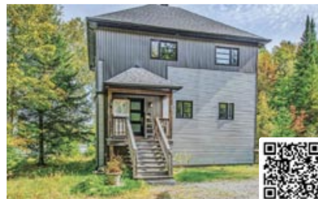
304 388e Avenue | Saint-Hippolyte 585 000 $