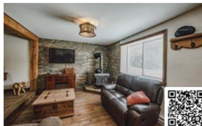
1911 Hauteurs | Saint-Hippolyte 735 000 $