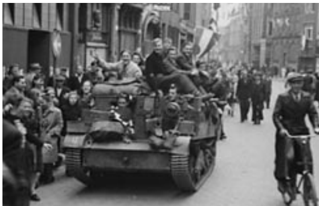
Civils néerlandais célébrant la libération, 1945.

Le Festival canadien des tulipes, qui est reconnu pour être le plus grand festival de tulipes au monde, est un événement majeur organisé chaque année à Ottawa. Plus d'un million de tulipes fleuriront cette année du 8 au 18 mai : ottawatourism.ca/fr