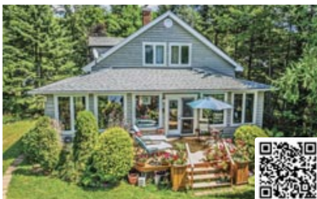
93 202e Avenue | Saint-Hippolyte 975 000 $