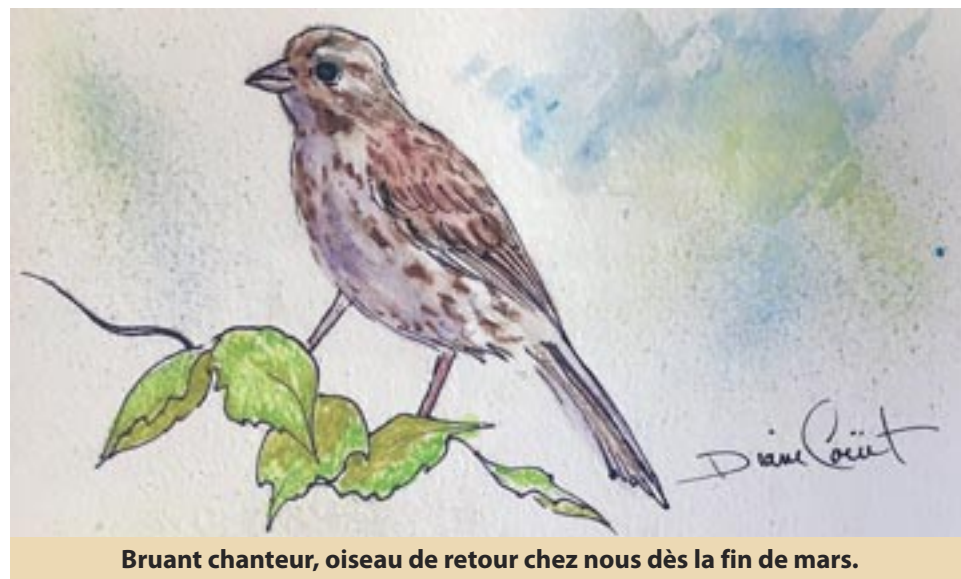
Bruant chanteur, oiseau de retour chez nous dès la fin de mars.

Avec leurs longues pattes fines, les Cerfs de Virginie n'aiment pas marcher dans la forêt lorsqu'ils calent dans la neige fondante. Le 15 avril, trois d'entre eux, des jeunes d'un an environ, ont emprunté le chemin commun à