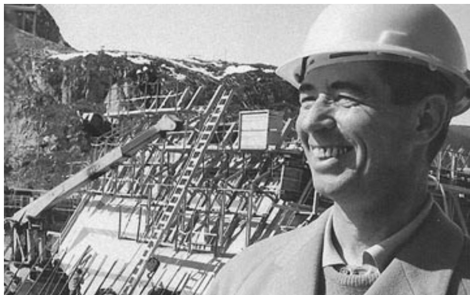
Hergé lors de sa visite au complexe Manicouagan-Outardes.

Il faut se situer dans l'époque : la Révolution tranquille et Guy Rocher n'ont pas encore éradiqué l'élitisme, qui consiste tout simplement à choisir le meilleur dans un domaine pour que la société fonctionne bien. L'effort est récompensé. L'élimination, désolé pour le rappel de ce mot tabou, le dîner de l'écolier préparé par la mère à la maison, les leçons apprises par cœur, le cheval à la cabane à sucre traditionnelle, sont des particularités complètement inconnues par les jeunes de nos jours.