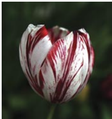
La très rare tulipe semper augustus .

Au cours de la Seconde Guerre mondiale, la majeure partie du continent européen est occupée par les forces d'invasion de l'Allemagne nazie, y compris les Pays-Bas. Ce territoire s'avère être un champ de bataille très difficile à conquérir, en raison de son réseau complexe de canaux et de digues. En 1944, les Alliés lancent des assauts audacieux, mais la détermination des Allemands est inflexible et le conflit s'éternise. L'hiver 1944-1945, surnommé « l'hiver de la faim », fut une période terrible. En raison du manque de nourriture, plusieurs ont été réduits à manger des bulbes de tulipes pour survivre. Après les combats acharnés des soldats canadiens et alliés, les forces ennemies se rendent et le territoire des Pays-Bas est libéré quelques jours avant la déclaration de la fin de la guerre, le 9 mai 1945.