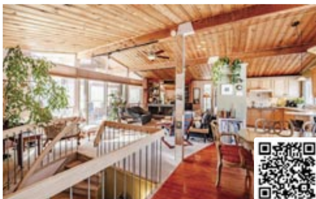
54 129e Avenue | Saint-Hippolyte 585 000 $