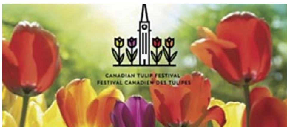
Festival canadien des tulipes 2026.