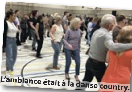
L'ambiance était à la danse country.

Nous avons eu la chance d'avoir la présence de notre député fédéral, Tim Watchorn. C'était pour nous une première rencontre et elle fut très appréciée. Malgré un horaire très chargé, madame Sonia Bélanger, ministre de la Santé et ministre responsable des Aînés et des proches-aidants, accompagnée de son conjoint, est venue souper avec nous et