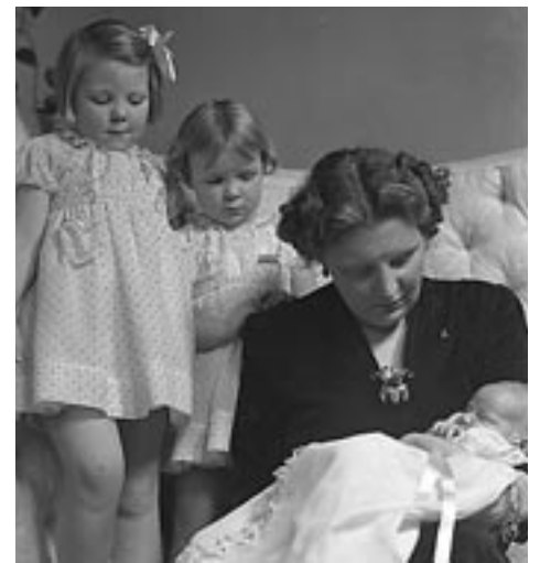
La princesse Juliana des Pays-Bas, les princesses Beatrix, Irene et Margriet, 1943.