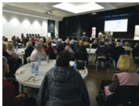
Un grand nombre de personnes présentes lors de la conférence.