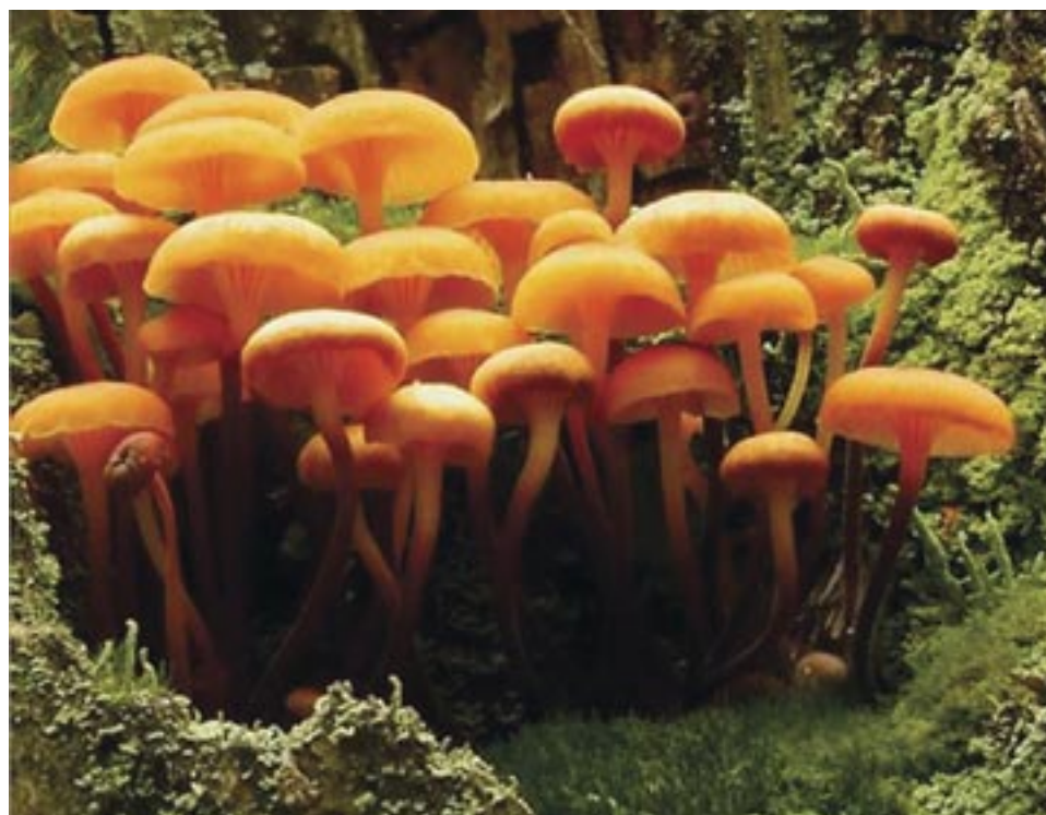
Omphale en clochette

F-o-n-g-e, vous avez bien lu. Ce terme existe depuis le 19 e siècle, mais nous commençons tout juste à en entendre parler dans les médias grand public. Quand les écologistes nous interpellent sur l'importance de la biodiversité, ils parlent désormais de protéger la faune, la flore et... la fonge 1 .