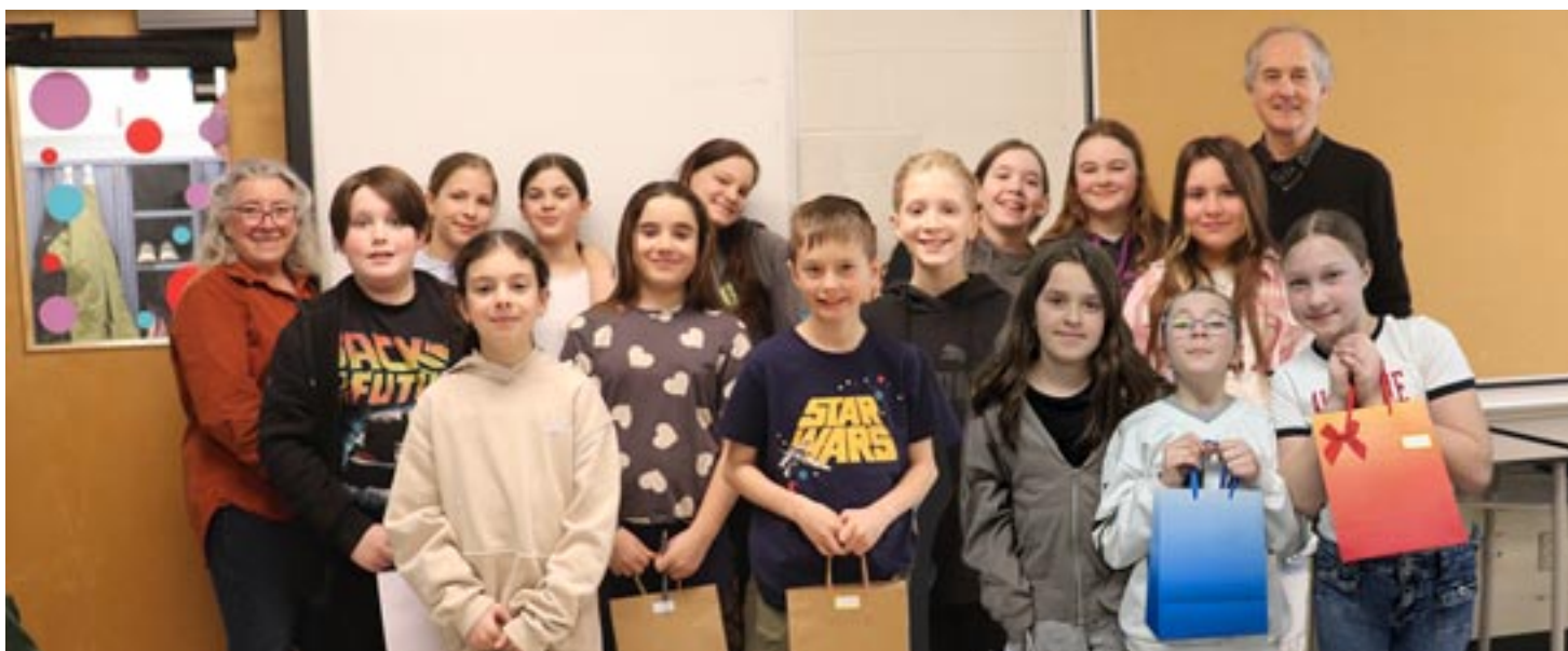
Photo des P'tites plumes qui ont participé à l'activité durant l'année 2025-2026.

La session d'hiver de l'activité Les P'tites plumes s'est terminée il y quelques semaines. Une dizaine d'élèves de l'école des Hauteurs ont délaissé leur récréation, une fois semaine, pour vivre une aventure journalistique.