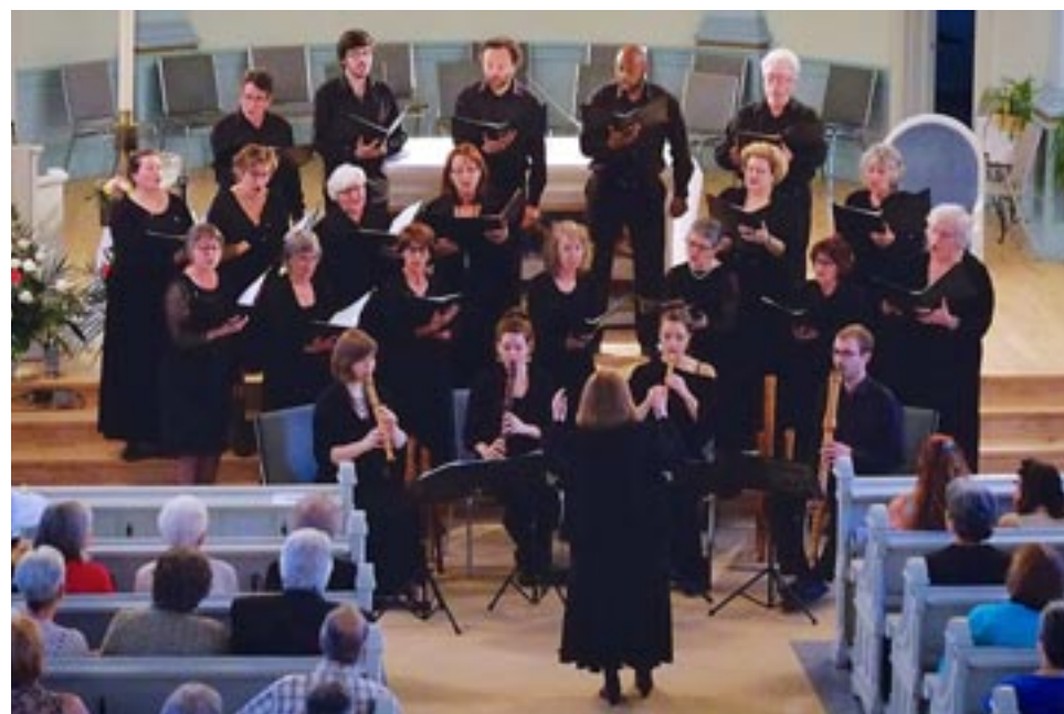
Photo prise en 2014 à l'Église Saint-Elzéar à Laval, lors de la première collaboration entre les deux ensembles.