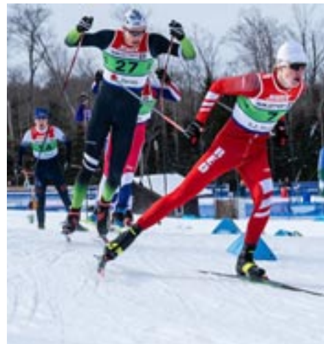
À l'œuvre en ski de patin.

Plus de 1000 participants ont pris part à la finale de la 40 e édition de la Coupe des Fondeurs de ski de fond le 8 février au centre Notre-Dame de Saint-Jérôme. « Nous avons rassemblé plus de 2300 participants pour les trois samedis de la Coupe des Fondeurs cette année », précise Martin Richer.