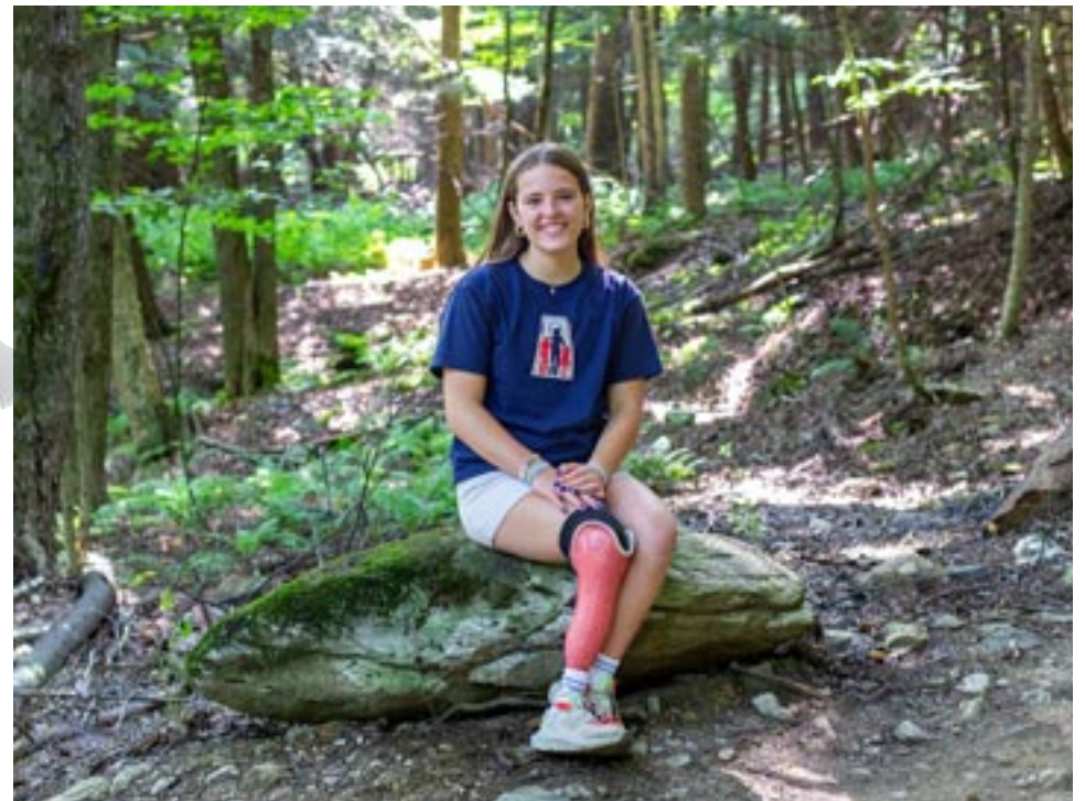
La Vainqueur Florence peut bénéficier du Programme LES VAINQUEURS grâce à la générosité du public.

Le Service des plaques porte-clés, qui a été fondé en 1946 par des anciens combattants amputés, est offert gratuitement partout au pays. Il permet de retourner les clés perdues à leurs propriétaires tout en générant des fonds pour les divers programmes de l'asso-