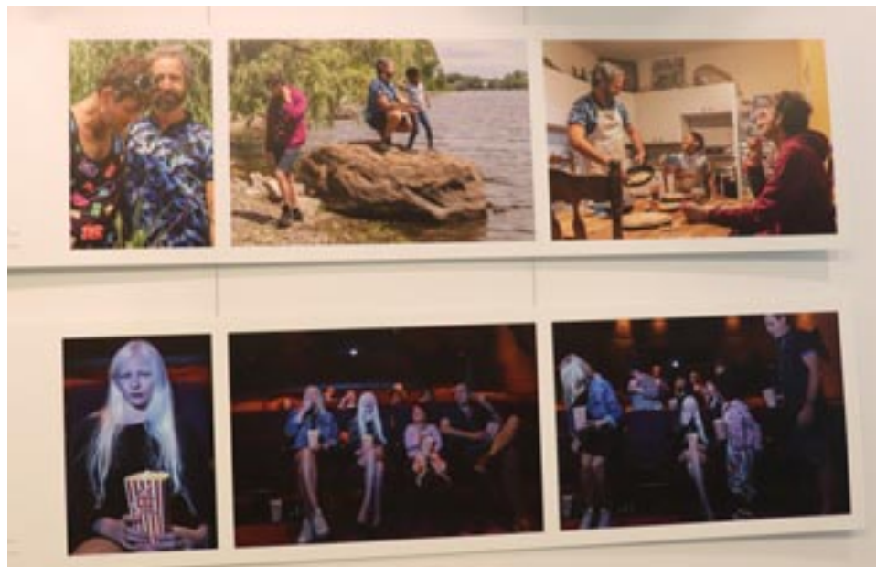
Deux bandes photos de la série Præter .

L'exposition Præter de Christyna Pelletier sera à l'affiche jusqu'au 25 mars dans la salle multifonctionnelle de la bibliothèque. La photographe adopte une approche documentaire éditoriale. Elle nous incite à nous interroger sur notre conception de la diversité.