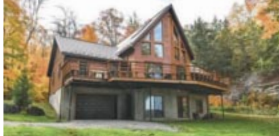
Bord de l'eau lac de l'Achigan. Magnifique plan d'eau navig. de 5,3 km 2 . Construction récente de qualité sup. 258 pi. de rivage. Plage de sable. Grande portion de terrain plat. Immenses pièces, garage intégré, plafond cath., fenestration imposante, grande terrasse sur le lac. Bienvenue!! Centris 14644248 Michel