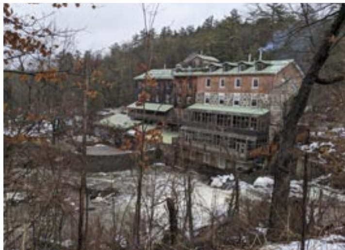
Le Moulin de Wakefield.

Du 28 au 31 décembre 2023, nous étions attendus chez mon beau-frère et sa conjointe qui possèdent une maison à Sainte-Cécile-de-Macham, village qui fait partie de la MRC des