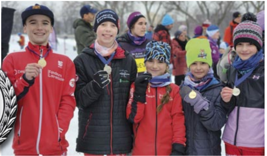
Bravo aux cinq jeunes fondeurs de Saint-Hippolyte.