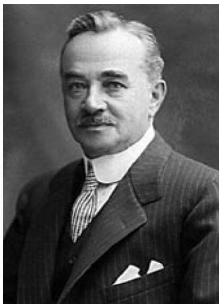
Milton S. Hershey

Milton S. Hershey est né le 13 septembre 1857 à Derry Township en Pennsylvanie. Il fréquente l'école primaire (4 e année) et devient apprenti chez un confiseur. En 1886, il fonde une confiserie qui devient prospère et qu'il vendra pour la somme d'un million de dollars en 1900. Il s'intéresse de plus en plus au chocolat, achète les machines nécessaires et fonde The Hershey Chocolate Company en 1894. En Pennsylvanie, en 1905, Hershey inaugure sa nouvelle usine et acquiert les terrains avoisinants. Pour ses employés, il fait construire logements, école, église et autres services. Cette cité ouvrière prend le nom de Hershey. Ne pouvant avoir d'enfants, Milton et son épouse s'impliquent dans des activités philanthropiques. Catherine meurt en 1915 et trois ans plus tard, l'in-