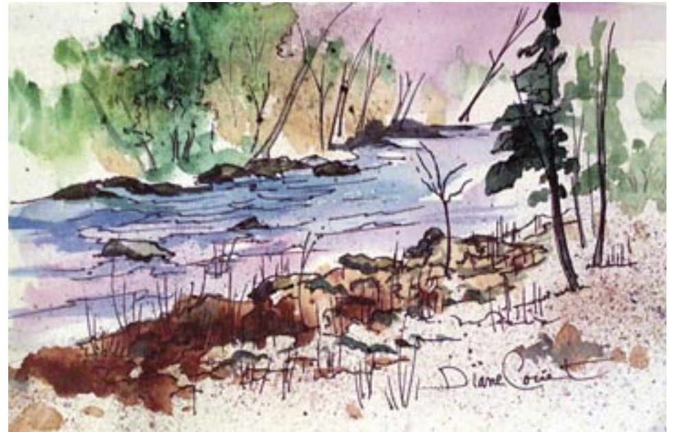
Aquarelle de Diane Couët.

Le lendemain de la fête familiale où le clan Beaudry était réuni, nous étions