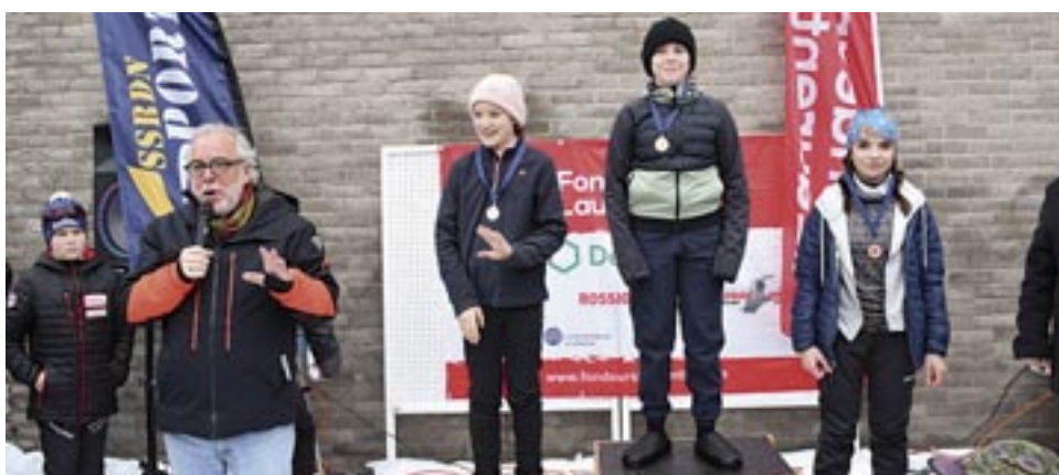
Lauréats d'une épreuve de ski de fond en présence du député du Bloc québécois Rhéal Éloi Fortin.