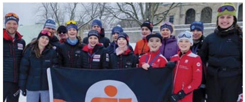
Un groupe d'athlètes se qualifiant pour les Jeux du Québec.