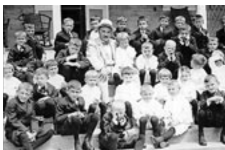
Une de ses œuvres philanthropiques.

dustriel fait don de 60 millions de dollars à une fondation chargée de poursuivre leur œuvre. Il décède le 13 octobre 1945 dans la ville qu'il a créée et qui porte son nom.