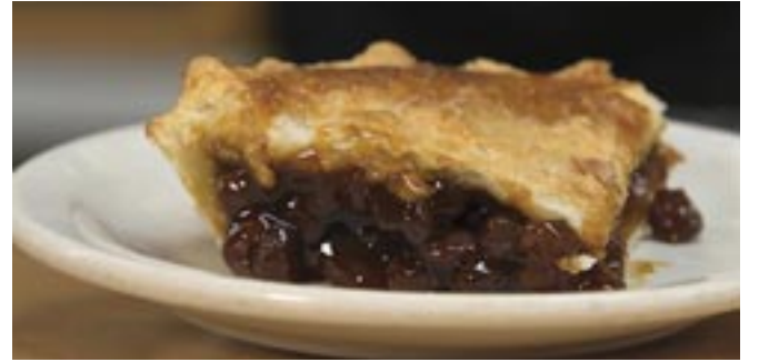
Tarte à la ferlouche.

Je vous entends. Vous allez m'écrire me précisant qu'on nommait cette tarte dans votre famille : ferlouche, faisant allusion au fer dans la mélasse, farlouche et même forlouche. Vous avez raison. Ce mélange de sucre épaissi d'un féculent et dans lequel on ajoute différents ingrédients est connu sous plusieurs noms. La cassonade a remplacé la mélasse; les raisins ont été remplacés par une variété de noix et de fruits et l'abaisse complète de pâte du dessus, par des bandes entrecroisées. Aujourd'hui, selon certains pâtisseries et pâtisseries, elle est plus populaire durant la période des Fêtes.