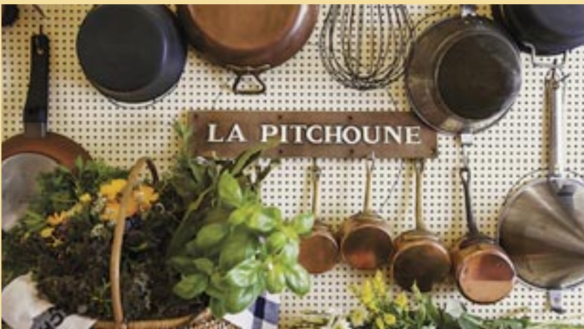
Nom donné à la « petite » maison de Julia Child.