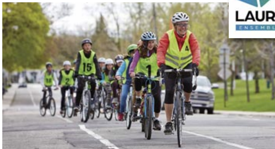
De jeunes cyclistes encadrés par des instructeurs bénévoles de Vélo Québec.

Vous êtes un amateur de vélo et êtes disponible le jour durant les semaines des mois d'avril, mai et juin ? Loisirs Laurentides est présentement à la recherche d'instructeurs bénévoles. Les instructrices et instructeurs Cycliste averti sont garants du succès et de la réussite