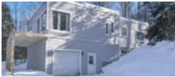
Lac de l'Achigan, pl.-pied secteur paisible. Cuisine et salles de bains au goût du jour. Vastes pièces. 2 SDB complètes et + de 1500 p.c. de sup. habitable sur un seul niveau. Jardin arrière aménagé avec un petit pavillon pour le spa. Vaste rangement au s.-sol avec un atelier et un garage avec plafond de plus de 12 pi. Centris 20161906 Michel