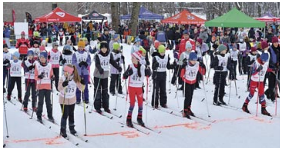
Les fondeurs au moment du départ.

L'événement permet à des centaines d'enfants et à leurs familles de découvrir ce sport. La participation financière de notre commanditaire majeur, les caisses Desjardins nous permet d'offrir un événement de qualité pour nos jeunes. Le site du centre Notre-Dame est un endroit idéal pour la présentation d'un tel