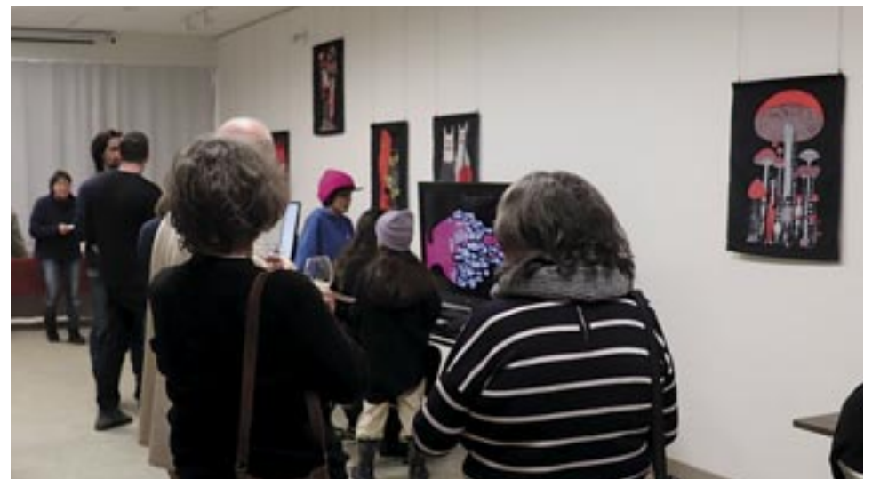
Vernissage du 11 janvier 2024.